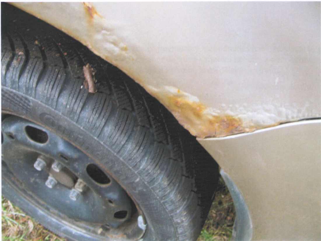
Detailní záběr na korozi levého zadního blatníku Fabie