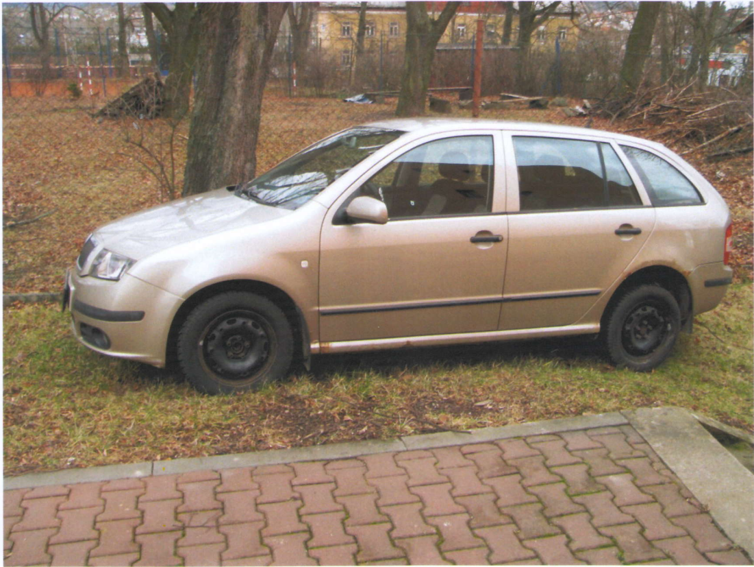
Pohled na levý bok Fabie